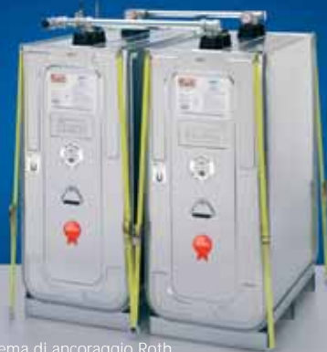
■ Sistema di ancoraggio Roth per l'impiego in zone a rischio di piene