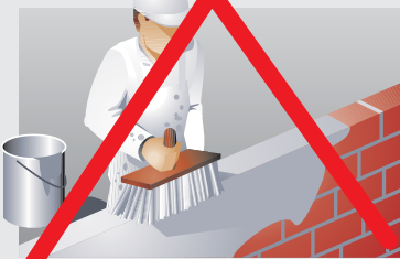
■ Muratura e sigillatura non necessario