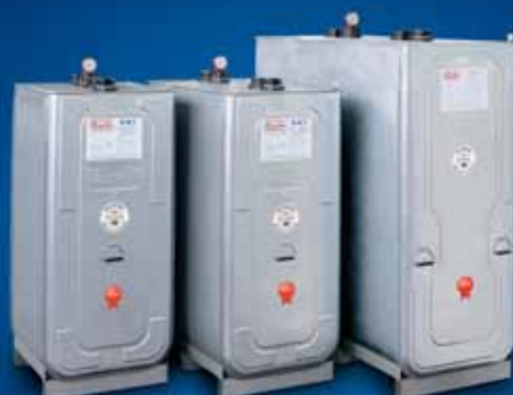
■ DWT plus 3 - 620 l, 1000 l e 1500 l